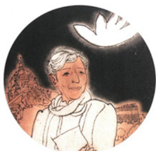
Dessin de Ye Sin