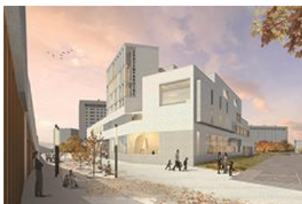
LE PROJET DE L'ATELIER BRUNO GAUDIN. VUE DU COURS NICOLE DREYFUS.

Financé par l'État, la Région Île-de-France, le PIA « Ville de Demain » porté avec le territoire Paris Ouest La Défense, et par des compléments venant, à ce stade, de l'Université et de La contemporaine , ce bâtiment de 6 500 m 2 , conçu par l'Atelier Bruno Gaudin, s'élèvera au pied de la nouvelle gare RER Nanterre-Université. Situé à l'entrée du campus universitaire et ouvert sur le territoire, il entend être un lieu innovant et participatif, mettant en perspective les sources de l'histoire contemporaine et offrant des espaces de consultation, de musée, de formation et de débat.